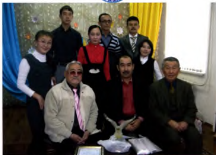
"Заламтер" - зорди қоралдық бірлестілігі ұжымы