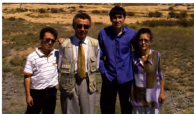
Ақжолға сапар: Жаңғос, мел, Минур, Мишкек