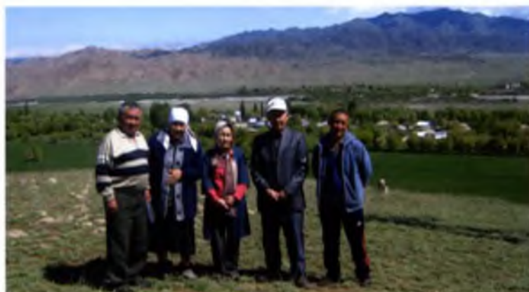
Алибас: Ҳурралиқ, Ҳурбуџи, Мишкен, мек. Қайрат