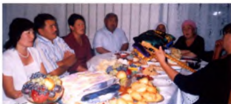
Зура, кудайылар: Айлаш, Әбш, Дарина, Әбш, теңей