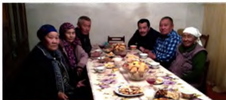
Ҳурбуџи, Мишкен, мек. Саламат, Ҳурралиқ, Булбузак.