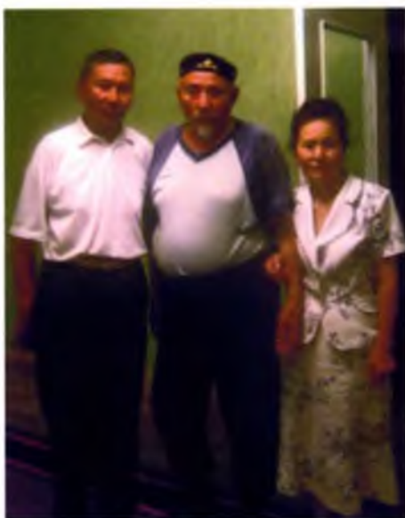
Мухади, Мухен аялбай, Мишкек