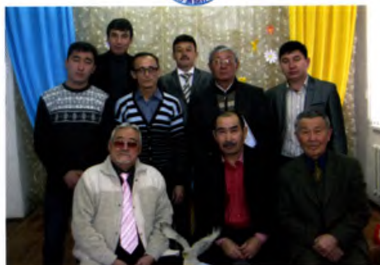
"Залалар" - өрбi қоралдық бiрлестiсiлiк ұжымы