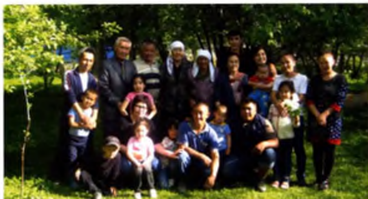
Алабастаги бауырларим мен келим, кечерелериммен