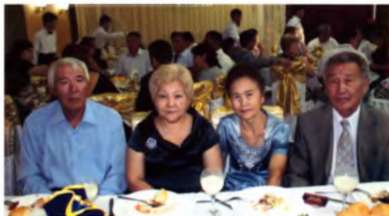
Бегали Бибиржан, Мишкен мен