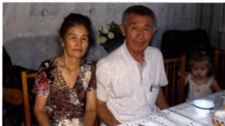
Мушкел, мек. Ауга