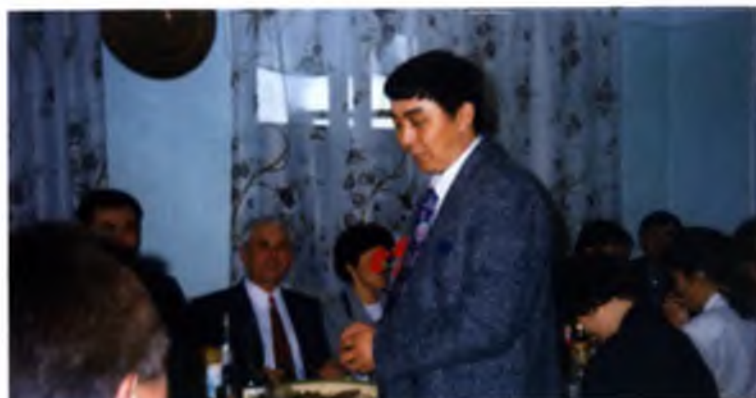
Жасулан тилек айткан кыз